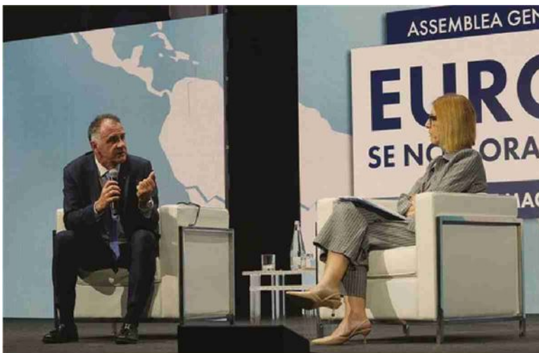
A Brescia. Emanuele Orsini, presidente di Confindustria, ieri all'assemblea degli industriali bresciani

3 Un debito comune, per finanziare una vera politica industriale europea Nuove emissioni di debito europeo per finanziare gli investimenti strategici.