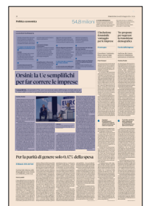
Peso: 1-5%, 10-38%

Stati Uniti e Cina stanno giocando la partita, con la Cina in particolare che ha aumentato le proprie esportazione nella Ue nel 2025 del 30%, causando una perdita complessiva di un milione