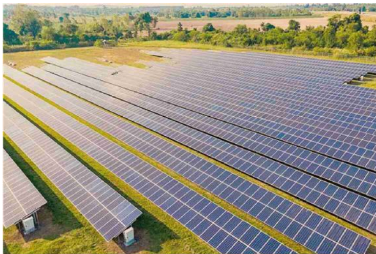
Pannelli. I 3 GW già installati in Sicilia sono soprattutto di fotovoltaico