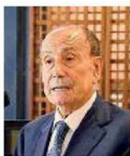
Il governatore Renato Schifani