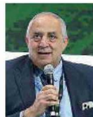
Nella foto grande il rogo ripreso da una videocamera Nella foto più piccola il sindaco di Palermo Roberto Lagalla