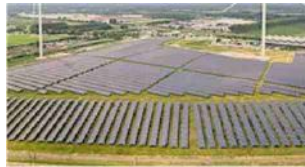
Energia pulita. Solare ed eolica