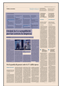
Peso: 1-5%, 10-38%