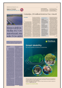
Peso: 1-2%, 19-26%

Accanto a questo percorso, la Regione ha approvato la norma sul Paur, il Provvedimento autorizzatorio unico regionale, per rendere più veloci le autorizzazioni ambientali. «Agendo nell'ambito del Testo unico nazionale sulle rinnovabili dice l'assessore regionale al Territorio e all'ambiente Giusi Savarino - e