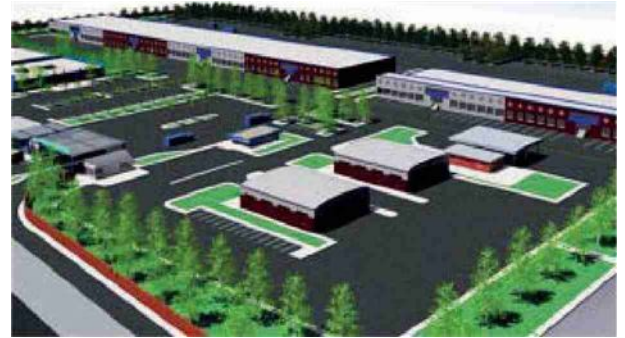
A sinistra il rendering progettuale dell'autoporto In alto a destra i protagonisti della stipula del protocollo