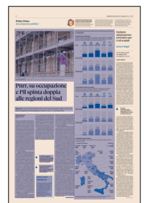
Peso: 1-4%, 8-72%

Il presente documento non è riproducibile, e' ad uso esclusivo del committente e non e' divulgabile a terzi.