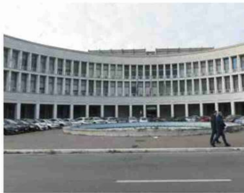
La sede dell'Inps