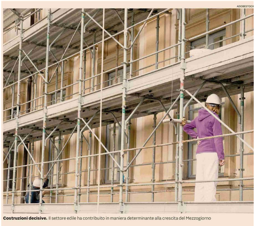
Costruzioni decisive. Il settore edile ha contribuito in maniera determinante alla crescita del Mezzogiorno

L'analisi dell'Ifel è fondata su un modello Var (vettoriale autoregressivo), che tiene in considerazione Pil reale e investimenti fissi lordi reali, entrambi in termini pro capite, l'evoluzione demografica e il ruolo del Fondo europeo di sviluppo regionale (Fesr)