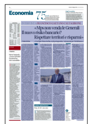
Peso: 1-3%, 32-66%

Il presente documento non è riproducibile, e' ad uso esclusivo del committente e non e' divulgabile a terzi.