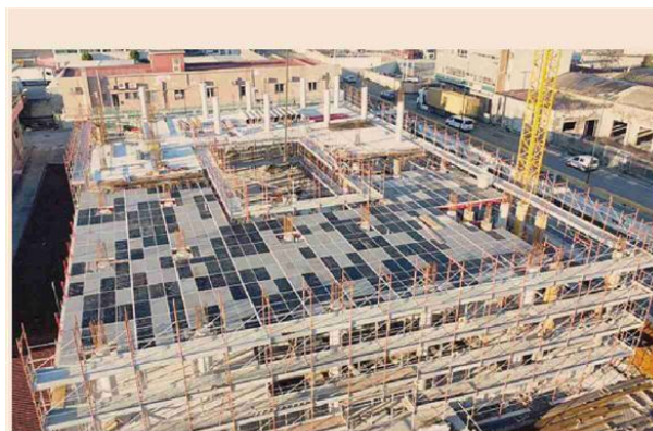
Investimenti. Lavori alla ex Whirlpool di Napoli assegnata a IGF dalla Zes

La Bei ha destinato al Mezzogiorno 12 miliardi circa nell'ultimo triennio, di cui cinque nel 2025