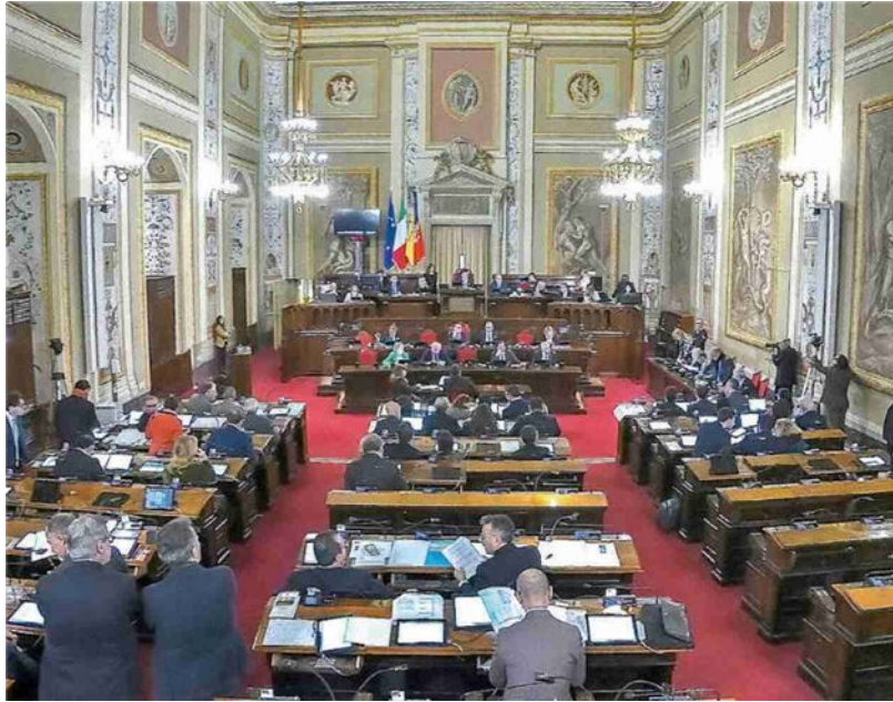
➤ Sala d'Ercole a Palazzo dei Normanni, sede dei lavori dell'Assemblea regionale siciliana