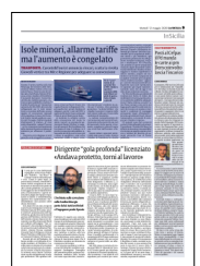
Peso: 1-2%, 9-30%

Gli aumenti sono stati contestati anche da Federalberghi isole minori.