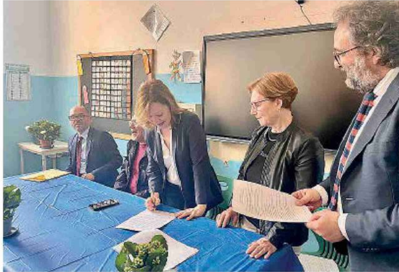
La firma del Patto ieri all'Istituto Rita Atria

cosa parlo. Si tratta di zone ricche non solo di possibilità economiche, ma soprattutto di possibilità di professionalità».