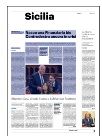
Peso: 1-1%, 9-35%