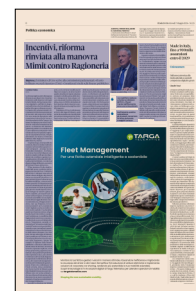
Peso: 1-2%, 8-31%