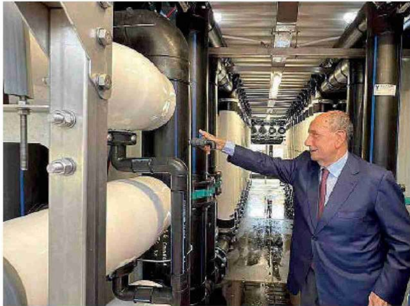
Il sopralluogo di Schifani al dissalatore di Porto Empedocle lo scorso luglio

Gli ambientalisti contestano i danni su natura e salute Dai dati del gestore l'impianto (costato 30 milioni) produce fino a 96 litri d'acqua al secondo. Ma grazie a piogge abbondanti e lavori sui pozzi non è più indispensabile