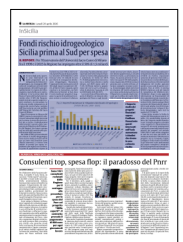
Peso: 1-3%, 6-48%

frana». Su questa porzione di territorio vive quasi il 10% della popolazione. In generale, il 95% dei comuni presenta aree a rischio di frane, alluvioni, valanghe o erosione costiera. Il monitoraggio degli interventi di riduzione del rischio idrogeologico viene svolto da Ispra attraverso il Repertorio nazionale degli interventi per la difesa del suolo (ReNDiS). Il rischio idrogeologico è definito da Ispra come una combinazione di pericolosità (probabilità che si verifichi un evento), esposizione (presenza di persone e beni nelle aree pericolose) e vulnerabilità (grado di danno atteso). Gli interventi di mitigazione del rischio agiscono quindi su una o più di queste componenti. Fino al 2016, il sistema ReNDiS registrava solo gli importi di competenza del Ministero dell'Ambiente; dopo si sono aggiunte informazioni sui finanziamenti di