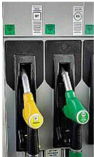
In distributore di benzina e diesel

Dopo l'annuncio dello sblocco di Hormuz, c'era stato un crollo del Brent del 9,2%