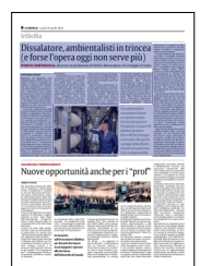
Peso: 1-3%, 8-46%

Nonostante la foto di rito con il rubinetto aperto, però, è la stessa Regione a chiarire che solo nel 2026 l'impianto ha iniziato a produrre. Nel contesto di una battaglia di "carte bollate" tra il gestore del servizio idrico di Agrigento Aica e Siciliacque, che degli impianti è soggetto attuatore, infatti, il Dipartimento Acque e Rifiuti