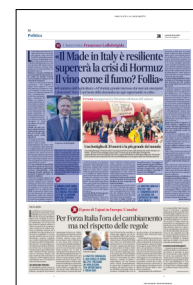
Peso: 1-2%, 10-45%