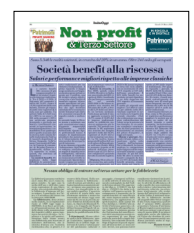
Peso: 1-2%, 36-46%