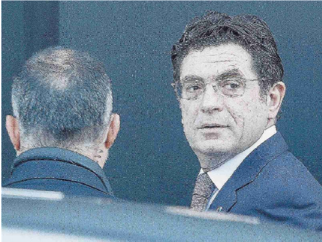
Caltanissetta L'ex presidente di Sicindustria Antonello Montante