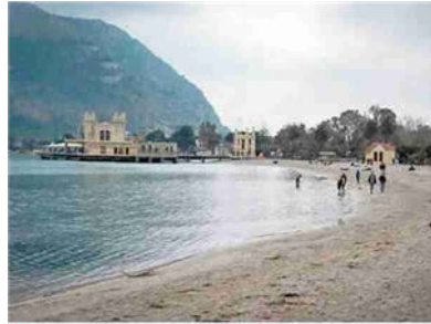
↑ La spiaggia di Mondello