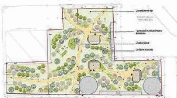
Area a Verde Pubblico 1 e 2: IL PARCO URBANO Planimetria

Alcune immagini virtuali del progetto che l'architetto Mario Cucinella ha immaginato per corso Martiri della Libertà. Una zona cittadina che da 73 anni attende di essere rigenerata come promesso prima dello sventramento