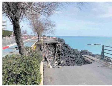
ISPEZIONI A sinistra Catania, a destra Santa Teresa di Riva Sopra, da sinistra in senso orario: Siracusa, Niscemi, Furci Siculo, i sopralluoghi del presidente della Regione Sicilia, Renato Schifani, nelle zone di Niscemi e Santa Teresa di Riva

18 mln Il nuovo plafond del Fondo Sicilia per finanziamenti a tasso agevolato destinati alla ripartenza delle imprese