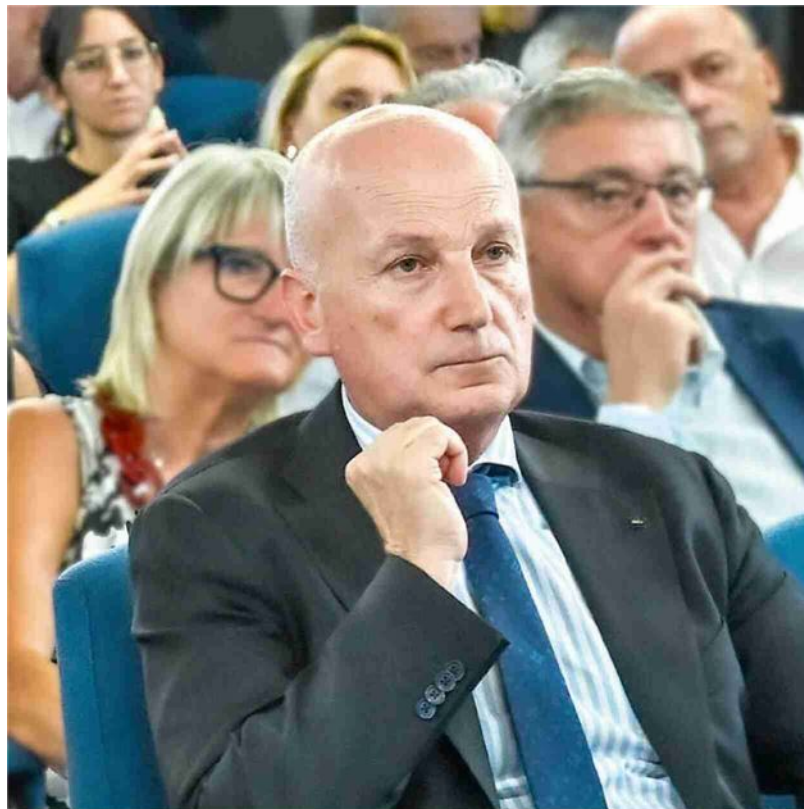
L'assessorato regionale della Salute a piazza Ottavio Ziino a Palermo

Le manovre per fare escludere una ditta concorrente e le mire sul business della riabilitazione