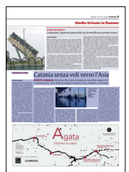
Peso: 1-1%, 5-30%