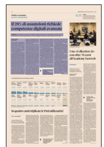
Peso: 1-1%, 10-23%