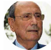
Il presidente Renato Schifani