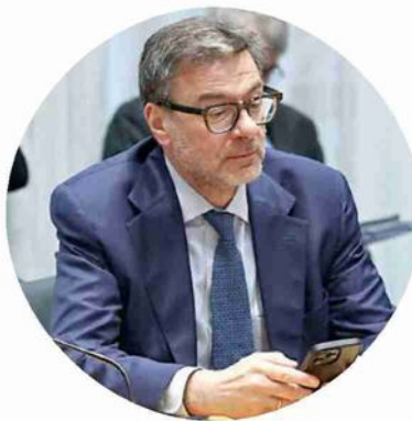
1 Giancarlo Giorgetti, 59 anni, ministro dell'Economia in quota Lega dal novembre del 2022

I gestori da giorni ribadiscono il concetto che i prezzi dei carburanti arrivano direttamente dalle compagnie petrolifere, ma sono comunque spettatori interessati delle evoluzioni di un quadro molto complicato. Sugli aumenti "una componente è sicuramente speculativa o lo è stata speculativa. Il problema è adottare delle misure necessarie", dicono le associazioni di categoria dei gestori.