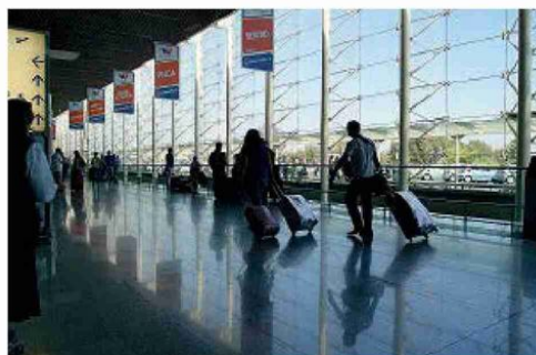
Catania è l'unico scalo siciliano a poter contare su un collegamento diretto con Dubai