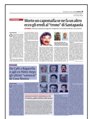
Peso: 1-2%, 9-37%