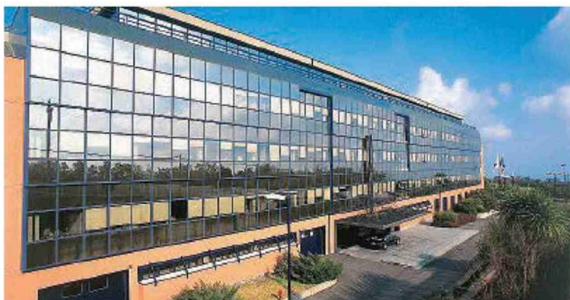
Lo stabilimento della Sifi, al centro di nuove polemiche

che non sono semplici numeri ma persone, madri e padri di famiglia, venga riconosciuta adeguata tutela. Serve trovare una soluzione per salvare questi posti di lavoro perché in gioco c'è il futuro non solo delle loro famiglie ma di un settore produttivo che ha avuto fino ad oggi un ruolo centrale nell'economia del nostro territorio».