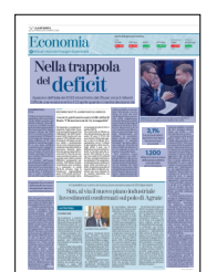
Allavoro Il ministro dell'Economia, Giancarlo Giorgetti con il commissario Ue all'Economia, Valdis Dombrovskis