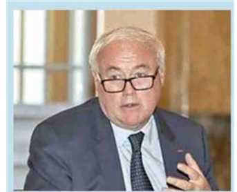
Jean Marc Chery, ad di Stm

lumi produttivi e occupazionali. «Non possiamo permettere - dice la Fiom - che, mentre si disegna il futuro al 2034, il presente venga lasciato scoperto, quindi chiediamo che il governo convochi il tavolo nazionale». Il prossimo passo sarà l'incontro, l'11 marzo in Regione Sicilia, per discutere del sito di Catania. —