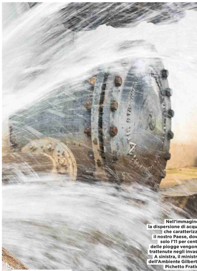
Nell'immagine, la dispersione di acqua che caratterizza il nostro Paese, dove solo l'11 per cento delle piogge vengono trattenute negli invasi. A sinistra, il ministro dell'Ambiente Gilberto Pichetto Fratin.