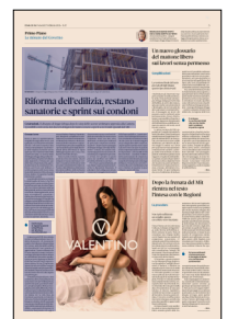
Peso: 1-7%, 3-35%

Tornando al merito del testo, viene confermata, allora, l'idea di fissare una sorta di anno zero per l'edilizia privata,