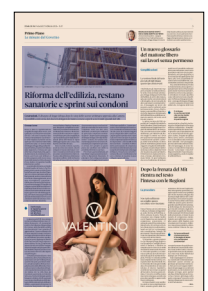
Peso: 1-7%, 3-35%