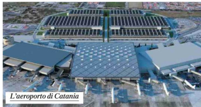
L'aeroporto di Catania

Secondo la tabella di marcia, il processo di privatizzazione inizierà con una fase di prequalifica, seguita da una fase di offerte non vincolanti e infine da una fase conclusiva che porterà alla presentazione di offerte vincolanti. (riproduzione riservata)