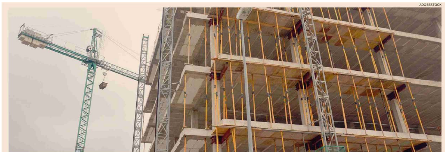
Gli obiettivi. Il disegno di legge delega punta a rivedere il Dpr n. 380/2001 toccando anche aspetti legati all'urbanistica

Confermata la regolarizzazione semplificata per gli abusi con oltre 60 anni