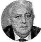
ROBERTO LAGALLA sindaco di Palermo