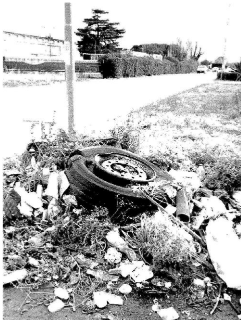
Aree industriali. Strade devastate dai rifiuti

La Zes Unica ha pubblicato l'avviso da 300 milioni per le infrastrutture di aree Asi in sette regioni