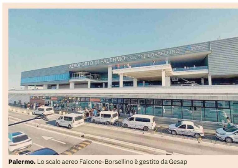
Palermo. Lo scalo aereo Falcone-Borsellino è gestito da Gesap