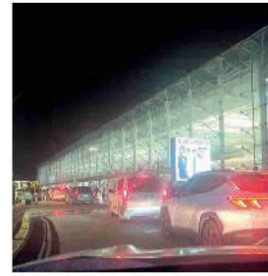
Un'immagine "solita" dell'Aeroporto

mettere in ginocchio le navette dei parcheggi privati o forse per spingere tutti dentro i parcheggi interni a pagamento. L'aeroporto è il primo e l'ultimo volto che milioni di persone vedono della nostra terra ed è interesse di tutti che sia efficiente e funzionale. Per questo presenterò un'interrogazione in Consiglio comunale per chiedere spiegazioni a chi siede nel cda della Sac e al sindaco Enrico Trantino».