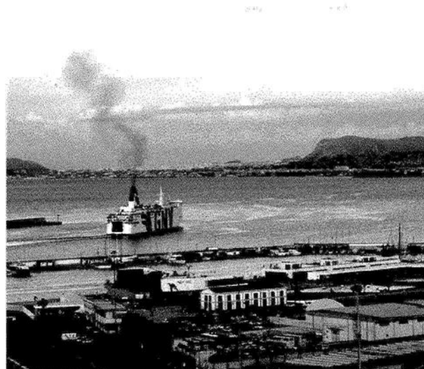
Infrastrutture. Il porto di Palermo al centro del piano di sviluppo

Attenzione al fronte Sud con Gela e Licata in particolare, strategici sul fronte mediterraneo