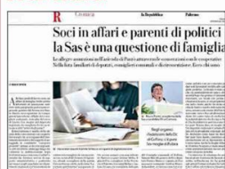
➤ L'inchiesta pubblicata ieri sull'informata di categorie protette nella società Sas