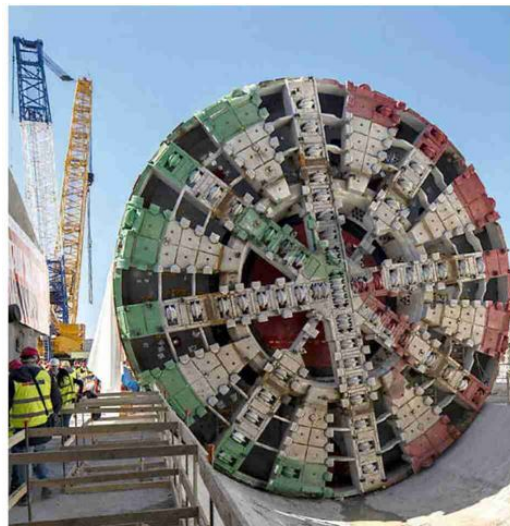
Un cantiere dell'alta velocità in Campania