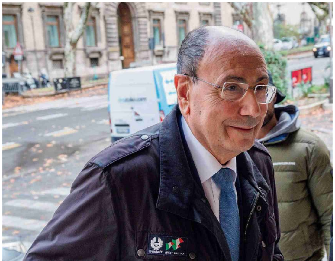
Forzista Il presidente della Regione Siciliana in quota FI, Renato Schifani, al primo mandato

"STIAMO lavorando per individuare soluzioni strutturali". Lo ha detto la presidente della Regione con l'interim alla sanità, Alessandra Todde (in foto) a proposito dell'intenzione di archiviare per sempre l'era dei medici gettonisti. "Dovremo monitorare la situazione del pronto soccorso nel passaggio tra la fine dell'attività dei gettonisti, che proseguiranno sino a giugno prossimo grazie anche a 1,8 milioni di euro derivanti dal quinto d'obbligo, e gli esiti del concorso. Sono preoccupata, è un contesto nuovo ma sono comunque fiduciosa"