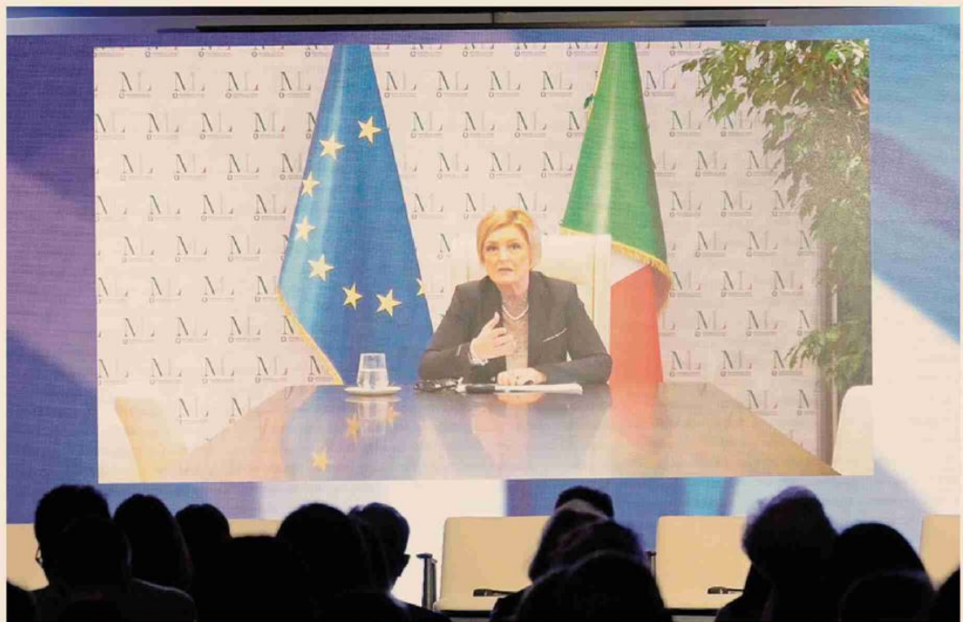
Il ministro del Lavoro. Marina Calderone ha partecipato a distanza ai lavori del Welfare & Hr Summit del Sole 24 Ore