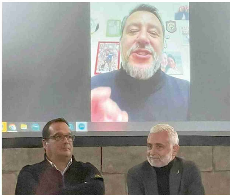
➤ Claudio Durigon e Nino Germanà in collegamento con Matteo Salvini