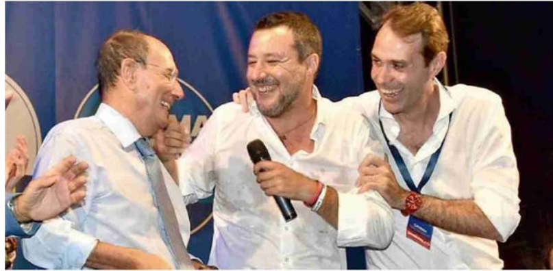
Il governatore Renato Schifani con Matteo Salvini e Luca Sammartino