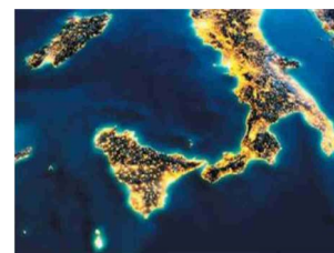
Candidature a partire dal 25 febbraio 2026

Il soggetto proponente ha facoltà di integrare l'entità del contributo con risorse aggiuntive proprie, esclusivamente a valere sulle stesse voci di spesa di cui al quadro economico della proposta progettuale oggetto della domanda. Pertanto, il contributo a fondo perduto previsto dal bando può arrivare a coprire fino al 100% della spesa ammissibile. Tuttavia, l'eventuale percentuale di cofinanziamento con risorse proprie contribuisce a incrementare il punteggio di accesso alla graduatoria per la concessione del contributo. Infatti, i fondi previsti dal bando sono concessi sulla base di una procedura valutativa con procedimento "a graduatoria".