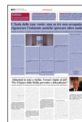
Peso: 1-23%, 7-56%