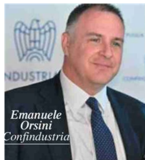
Emanuele Orsini Confindustria