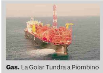
Gas. La Golar Tundra a Piombino