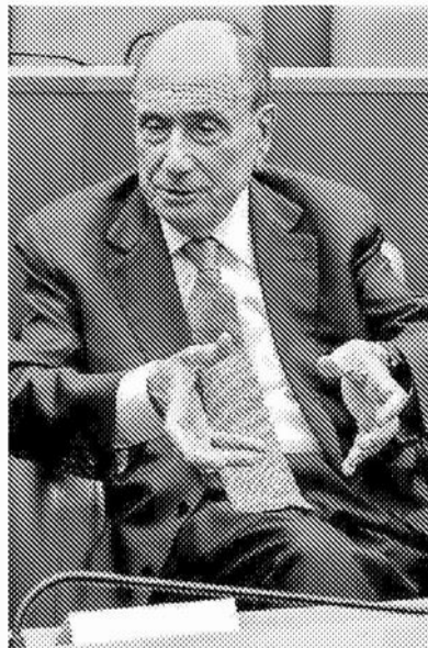
Renato Schifani presidente della Regione siciliana ed esponente di Forza Italia

zia e agli anziani, come denuncia l'Anci». Mannino attacca Schifani: «Il governo Meloni marcia compatto aggirando e calpestando i principi Costituzionali e in tal senso l'autonomia differenziata è un tassello di un disegno autoritario, un tassello destinato a produrre danni incalcolabili in Sicilia e nel Mezzogiorno d'Italia. Serve un rigurgito di dignità. Il presidente deve schiodarsi dalla comoda poltrona delle alleanze politiche e proteggere la Sicilia e i siciliani da queste inaccettabili incursioni. Non l'ha fatto prima, lo faccia ora: dica no allo smembramento del Paese e all'indebolimento dei diritti in Sicilia».