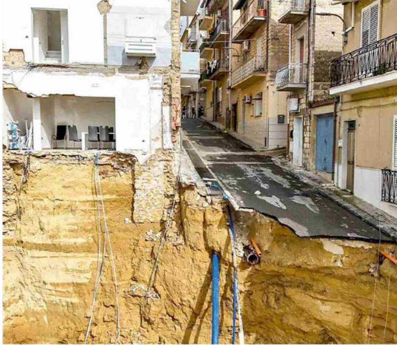
➤ La frana di Niscemi