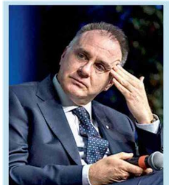
Alla guida Il presidente di Confindustria Emanuele Orsini

choc, il peso dell'energia sui costi di produzione resta ancora sopra la media 2018-2019 di oltre un punto percentuale. Per la Francia lo choc è invece quasi del tutto riassorbito, mentre la Germania segna +0,6 punti percentuali. È il raddoppio dell'incidenza dei costi energetici - a parità di condizioni produttive, in assenza di politiche di mitigazione e nella stringente ipotesi di linearità della relazione tra aumento dei prezzi energetici e produttività rispetto alle stime - potrebbe aver determinato in Italia, a seguito dello choc nel 2022, una riduzione della produttività delle imprese manifatturiere di circa l'8%. CLA. LUI. —