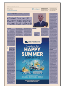
Peso: 1-1%, 5-44%

Il presente documento non è riproducibile, e' ad uso esclusivo del committente e non e' divulgabile a terzi.