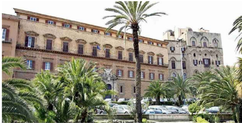
Palazzo dei Normanni, sede dell'Assemblea regionale siciliana