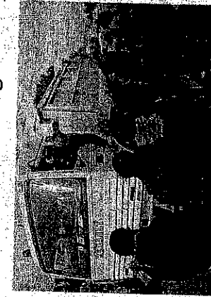
PALESRMO-AGRIGENTO. Manifestanti che bloccano autotrasportatori sulla strada statale.

Continuano nella provincia di Catania ad essere bloccate strade, ferrovie e porti. Isolati anche il mercato ortofrutticolo del Maso. Cinque blocchi a Palermo, dove ieri alla protesta si è unito un migliaio di studenti. Il presidente di Confindustria,