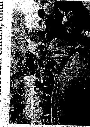
PALERMO. Momenti di tensione con gli automobilisti che cercano di forzare i blocchi.

zioni che non hanno consentito il passaggio ai lavoratori. L'Eni ha comunicato il rischio di un blocco generale e improvviso dello stabilimento. La polizia da giorni sta tenendo sotto controllo alcuni gruppi di giovani, particolarmente attivi, sospetti di gravitare nell'orbita delle cosche mafiose gelaes. Molti sarebbero stati fotografati e identificati. Emergenza rifiuti in provincia di Ragusa. Diversi autocamionisti sono rimasti bloccati e le strade di Vittoria, Comiso, Modica, Pozzallo, Ispica e Scicli sono piene di rifiuti. Gli autotrasportatori hanno bloccato quasi completamente la rotonda Giurone, nella valle del Feu-